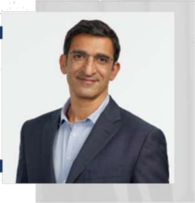
MATHIAS EMMERICH PRÉSIDENT EXECUTIF, INSEEC U.

Demandez-vous sincèrement en vous regardant dans les yeux : qu'est-ce qui compte vraiment pour moi ? qu'est-ce qui m'anime et va me donner envie de me lever tous les matins ?